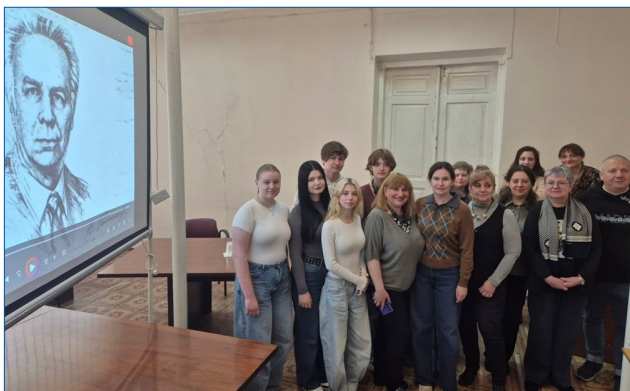
Учасники офлайн круглого столу «Наукова спадщина Володимира Роменця: сучасний погляд» (до 100-річчя з дня народження)

У процесі наукової дискусії учасниками наголошувалося, що теорія вчинку Володимира Роменця зберігає високу наукову актуальність та має значний потенціал для інтеграції з сучасними концепціями психології невизначеності, невизначеної втрати, психологічної стійкості та особистісної трансформації, особливо в умовах війни та кризових суспільних змін.