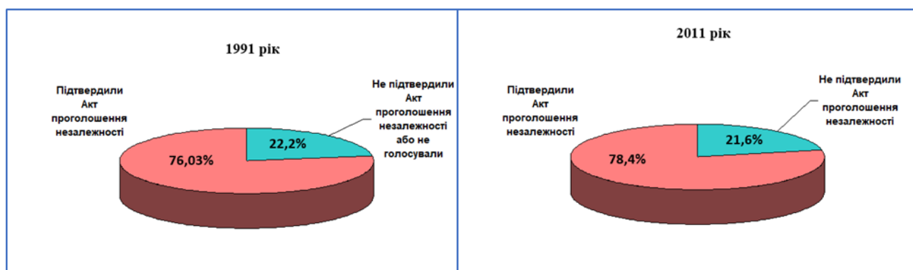
Рис. 1. Порівняльні дані ЦВК (1991 р.) і масового опитування громадян (2011 р.) щодо підтвердження Акта проголошення незалежності України (у % до загальної кількості осіб, що мали право голосувати)

Помітне зростання рівня легітимації Акта незалежності простежувалося й у наступні роки. При-