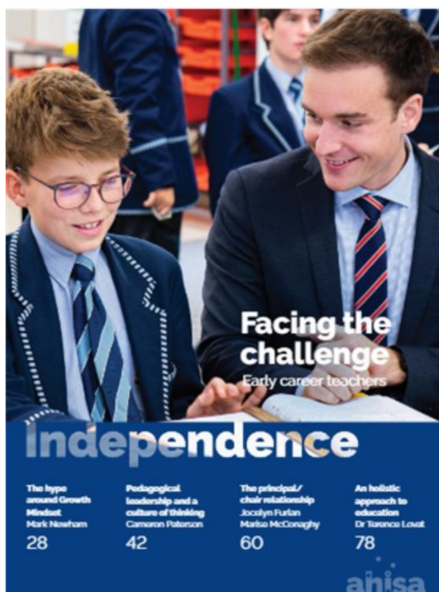
Обкладинка журналу «Independence»

Статтю А. Кокеріла в «Independence» доповнено рецензією на книгу «Наша школа в Павлиші. Холистичний підхід до освіти» доктора Теренса Ловата (Lovat et al., 2022), почесного професора Університету Ньюкасла (Австралія), колишнього президента Австралійської ради деканів освіти, який так говорить про В. Сухомлинського: «Він увібрав у себе великі істини, отримані в минулому, і передбачив новаторські відкриття, які ще попереду».