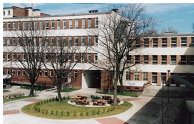
Akademia Pedagogiki Specjalnej im. Marii Grzegorzewskiej, dziedziniec, 2001 r.

(2) Ilościowo najliczniejszym instytutem (ponad 90 pracowników) jest Instytut Pedagogiki. Badania prowadzone przez zespoły naukowe instytutu ogniskują się wokół historycznych, kulturowych i społecznych uwarunkowań współczesnej edukacji, a ich efektem są pogłębione opisy zjawisk związanych z opieką, wychowaniem i kształceniem. Badacze Instytutu Pedagogiki czują swoje więzi z ideami, stanowiącymi fundament Uczelni. Jak czytamy na stronie Instytutu: «Podejmowane badania — zgodnie z misją patronki APS Marii Grzegorzewskiej — ujęte są w ramę aksjologiczną uznania i afirmacji ludzkiej podmiotowości oraz sprawiedliwości społecznej. W badaniach, kształceniu i działalności społecznej Instytutu podkreśla się niezbywalną godność i szacunek dla każdej osoby oraz prawo wszystkich podmiotów wychowania do rozwoju w warunkach odpowiadających ich możliwościom, potrzebom i aspiracjom» ( http://www.aps.edu.pl/instytuty/instytut-pedagogiki/obszary-dzialalnoscinaukowej/ ). Instytut sprawuje merytoryczną opiekę nad takimi kierunkami jak pedagogika, pedagogika opiekuńczo-wychowawcza i szkolna, pedagogika zdolności i informatyki, a także praca socjalna.