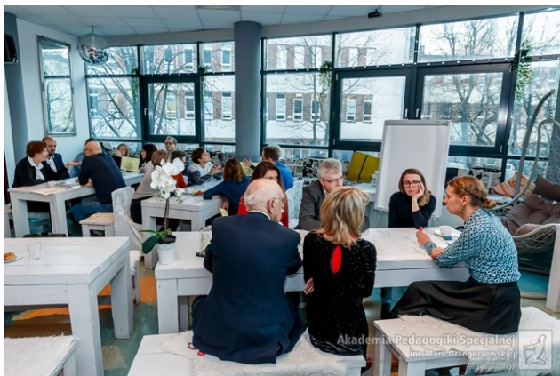
Społeczność ucząca się: warsztaty dydaktyczne dla nauczycieli akademickich APS