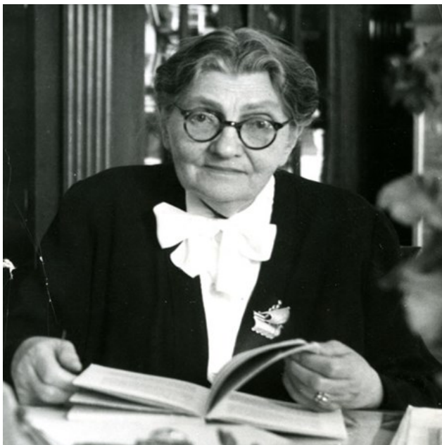
Maria Grzegorzewska w gabinecie, Ul. Szczęśliwicka 40, 1959 r.

watelskich praw, zrozumienia i akceptacji dla odmienności, traktowania niepełnosprawności jako niezbywalnego elementu ludzkiej kondycji oraz włączania osób niepełno-sprawnych w życie społeczeństwa na zasadzie równoprawnych obywateli» ( http://bip.aps.edu.pl/artykuly/440/misja-i-strategia ).