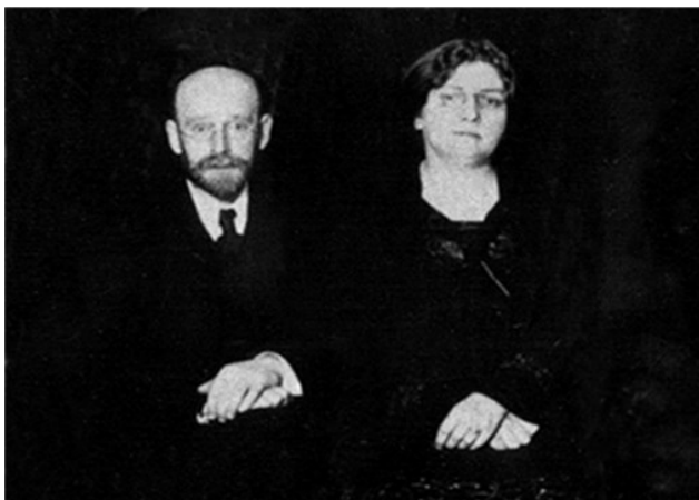
Maria Grzegorzewska (Patronka Roku 2022) i Janusz Korczak (Patron Roku 2012)