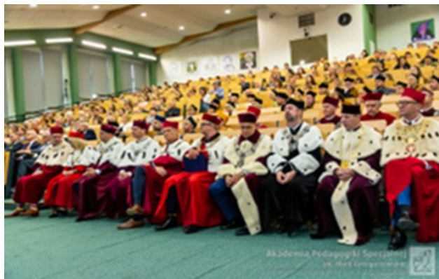
Święto Uczelni 2022_ uroczyste posiedzenie Senatu

Obchody miały stać się okazją do dalszej realizacji misji Uczelni, stanowić pasmo wydarzeń pogłębiających świadomość idei niezmiennie przyswiewających działalności uczelni i płynące stąd poczucie jedności środowiska jej pracowników i studentów. Zaplanowano je jako cykl tematycznie odpowiadających misji uczelni i przestaniem Jej Patronki konferencji i seminariów, istotnych naukowo, w których w kontekście odwołań do tradycji, zaprezentowano aktualny stan badań. Do uczestnictwa zapraszano przedstawicieli uczelni polskich i zagranicznych oraz partnerów ze środowiska zewnętrznego.