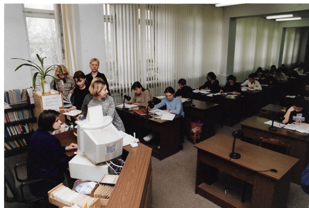
Społeczność ucząca się: praca w czytelni

Edukacji. Badania prowadzone przez pracowników instytutu wpisują się w idee misji Uczelni: Akceptacji, Partycypacji i Solidarności społecznej. Podejście badawcze naukowców instytutu cechuje bowiem nakierowanie na zmianę edukacyjnej rzeczywistości. Wielu pracowników pozostaje aktywnymi zawodowo nauczycielami instytucji edukacyjnych, przede wszystkim szkół i przedszkoli, stąd mogą prowadzić «badania w działaniu», rozwijając paradygmat pedagogiki krytycznej. Sprawują merytoryczną opiekę nad kształceniem studentów na kierunku pedagogika przedszkolna i wczesnoszkolna, a także logopedia, w ścisłym związku z edukacyjnymi realiami a zarazem — zgodnie ze wskazaniem Marii Grzegorzewskiej — dążąc z zaangażowaniem do ich twórczej zmiany: czynienia rzeczywistości edukacyjnej wyzwalającą i w pełni podmiotową dla każdego jej uczestnika.