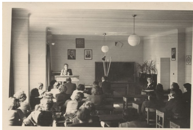
Zajęcia ze słuchaczami PIPS-APS 1951 r.