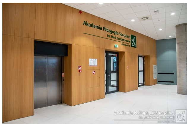
APS 2022- wnętrza nowego budynku kampusu przy Ul. Szczęśliwickiej 40

Rok 2022 był rokiem szczególnym dla Akademii Pedagogiki Specjalnej im. Marii Grzegorzewskiej oraz dla uczczenia pamięci i docenienia nieprzemijalności dorobku Jej Patronki. Wydaje się, że przywołanie wydarzeń, które złożyły się na całość obchodów może stanowić przykład wyzwiania synergii pomiędzy samą organizacją obchodów i wspólnym «świętowaniem» a dalszą intensyfikacją badań i popularyzacją humanistycznych idei, okazją do zacieśniania współpracy środowisk akademickich (z Polski i spoza jej granic, w tym z Ukrainy), skupiania wokół siebie instytucji środowiska społecznego, czy wreszcie dbałością o rozwój kultury i kształcenie wrażliwości estetycznej osób uczestniczących w obchodach. Obchody 100-lecia APS stanowiły kolejny krok, by stawała się Akademią Przyszłego Stulecia.