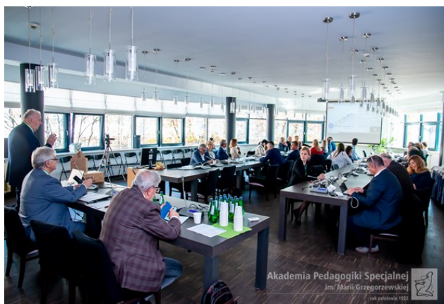
Obrady konferencyjne w APS 2022 r.