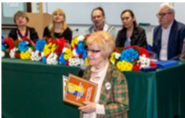
Spotkanie w APS w ramach IX Forum Polska-Ukraina 2022 r.